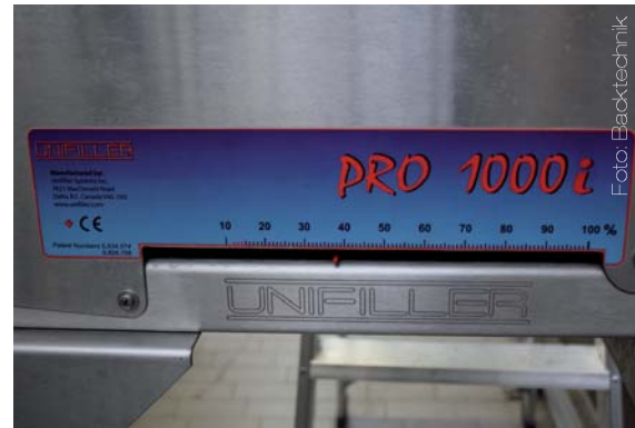
Bild links: Die runden Formen werden von einem Fotosensor erkannt, in den Gates fixiert und mit der entsprechenden Menge an Masse gefüllt. Bild Mitte: Die Erweiterung der Anlage mit einer zweiten Dosierstation wäre denkbar, damit weitere Schritte automatisiert werden können. Bild rechts: Die Einwaage kann über Volumen in Prozent und die Stärke des Zylinders verändert werden.

Vorsätze, die für unterschiedliche Anwendungen eingesetzt und nach Kundenwunsch individuell hergestellt werden können, noch erhöht. So ist es denkbar, Saison-Gebäcke oder eigene Gebäckideen mit der Anlage umzusetzen, um sich vom Wettbewerb abzuheben. Zunächst wird die abzufüllende Masse in den Trichter der Dosiermaschine gegeben und von dort in den Produktzylinder eingezogen. Die Füllmenge ist stufenlos über zwei Größen einstellbar. Zum einen über den Zylinder, der in unterschiedlichen Durchmessern verfügbar ist, und zum zweiten über den Kolbenhub. Dieser Wert wird in Prozent angegeben, kann per Hand eingestellt werden und legt fest, wie weit der Kolben im Zylinder zurückfährt. Über das Volumen wird das Gewicht der abzuwiegenden Masse bestimmt. Mit drei unterschiedlichen Zylindern in den Stärken eins, zwei und drei und der Volumeneinstellung ist es dem Anlagenführer möglich, Gewichtsbereiche von 15 Gramm bis 1100 Gramm, je nach spezifischem Gewicht der einzelnen Massen, abzudecken. Während die Masse in den Produktzylinder eingezogen wird, ist der Querkolben mit der Füllöffnung offen. Ist das Volumen erreicht, verschiebt sich